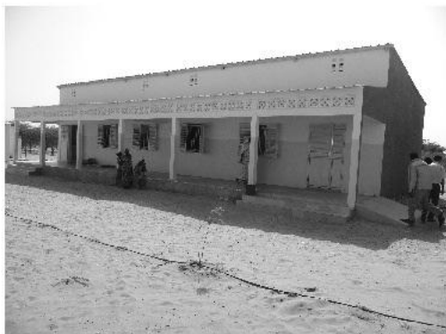
Salles de classe construites lors de l'intervention dans l'école de Démizine