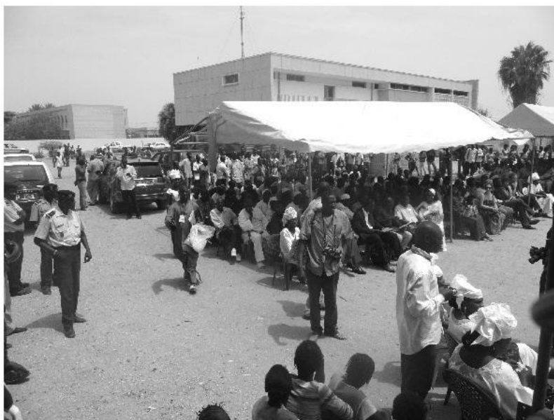
La pose de la première pierre a fortement mobilisé les populations

Le CECIDD est un projet porté par le collectif des enseignants de Saint Louis et appuyé par Le Partenariat. Le collectif est un partenaire historique du Partenariat et intervient depuis 1996 à nos côtés sur différents programmes de correspondance scolaire et d'éducation au développement.