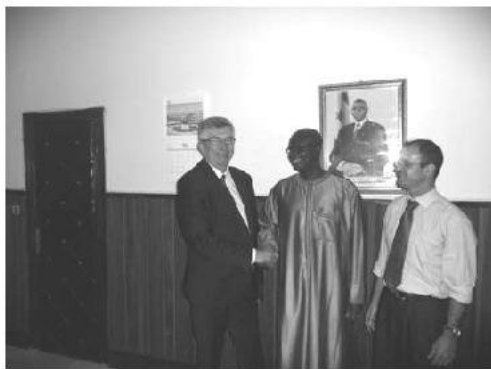
Rencontre avec Monsieur Kalilou DIALLO, Ministre de l'Education Nationale

Chargé du suivi de la coopération à Lille