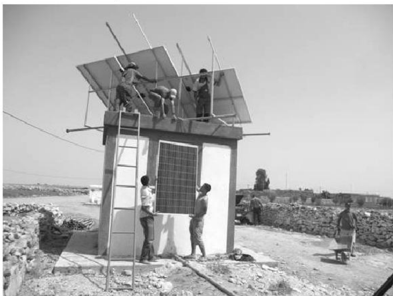
Pose d'une pompe photovoltaïque dans le Douar Ben Bouchaïb

A lors que nous sommes en train de définir les contours du prochain programme de coopération entre les Régions du Nord Pas de Calais et de Doukkala Abda, le programme actuel arrive à son terme. Pour Le Partenariat, ce programme a été l'occasion d'acquérir une expérience particulière dans le domaine des systèmes de pompage photovoltaïque et de filtration de l'eau en vue de leur potabilisation.