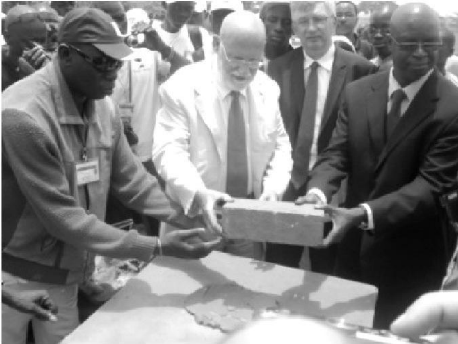
Le Ministre de l'Education Monsieur Kalilou DIALLO, aux côtés de Monsieur MONTUELLE, Président du CDG59

Monsieur Kalilou DIALLO, Ministre de l'Education Nationale, a procédé à la pose de la première pierre du CECIDD, accompagné de Monsieur Marc MONTUELLE, Président du CDG59