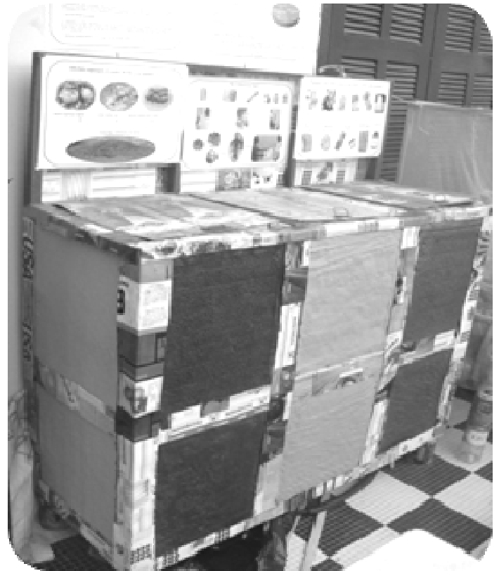
Bacs de tri des déchets

La commune de Podor poursuivra les actions déjà menées en matière de traitement des déchets. Elle mettra en œuvre un programme de tri et de valorisation afin de parvenir à mieux maîtriser sa quantité d'ordures. La commune de Rosso lancera un programme de traitement des déchets avec la remise en conformité de sa décharge et la création de groupes de collecte.