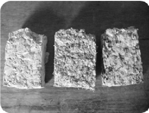
Briquettes de papier

Dans le cadre du programme PERACOD, porté par la coopération allemande, et en partenariat avec le Groupement d'Intérêt Economique (GIE) Bioéco, un projet de diffusion des foyers améliorés dans le Département de Podor a été lancé en décembre 2011. Il prévoit de structurer la filière et d'accompagner les réseaux locaux de forgerons et de potières. Il a pour objectif de diffuser 3 000 foyers d'ici 1 an dans la Région de Saint-Louis.