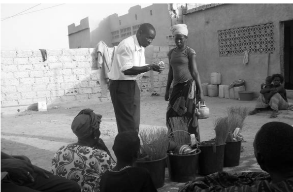
Démonstration du lavage des mains par l'agent des Services d'hygiène

D ans le cadre du programme de coopération entre Rosso Sénégal et Saint-Laurent Blangy Le Partenariat a accompagné la commune de Rosso pour un projet de construction de dix latrines individuelles dans les maisons des ménages les plus démunis. Ces ménages avaient été identifiés par la Mairie et sélectionnés sur la base des critères définis par le Comité de pilotage du projet.