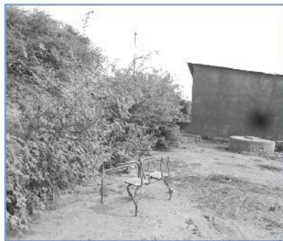
Le résultat aujourd'hui

Au final, la réussite de l'intervention a été permise par la participation de nombreux acteurs, Inspection d'Académie, Service des Eaux et Forêts, parents d'élève, enseignants, enfants et par l'engagement initial du CDC DEVELOPPEMENT SOLIDAIRE qui a permis la réalisation de ce beau projet.