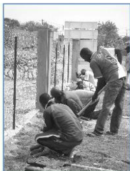
Mobilisation des Parents d'élèves et de la communauté

Témoin du changement important vécu par l'école de Sinthiou Garba 2 : La clôture haie vive, bon exemple de mobilisation communautaire.