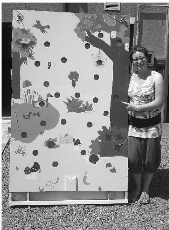
Le volon'balle fait partie des activités du Parcours Volon'Terre