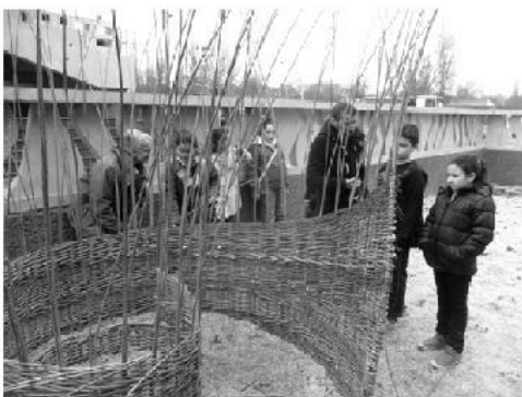
fabrication d'un bac à compost en osier vivant