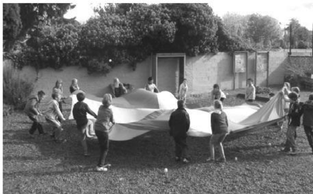
Jeu du parachute

L e centre a été bien rempli du 24 au 28 septembre : 30 enfants de l'école Jacques Brel de Marquette-lez-Lille ont passé une semaine de découvertes à Gaïa. Au programme de cette activité : atelier d'immersion, jeux coopératifs, parcours VolonTerre, ateliers développement durable... La semaine entière était organisée autour des notions de solidarité et de coopération. L'atelier d'immersion est l'activité qui a le plus plu aux enfants, même s'ils ont beaucoup aimé, juste après l'atelier, fabriquer des awalés, des djembés et participer tous ensemble à la confection d'un boubou. Vendredi pour la dernière journée, les parents étaient invités à venir découvrir ce que les enfants ont vécu. Beaucoup ont répondu présent et ont pu découvrir les photos des activités.