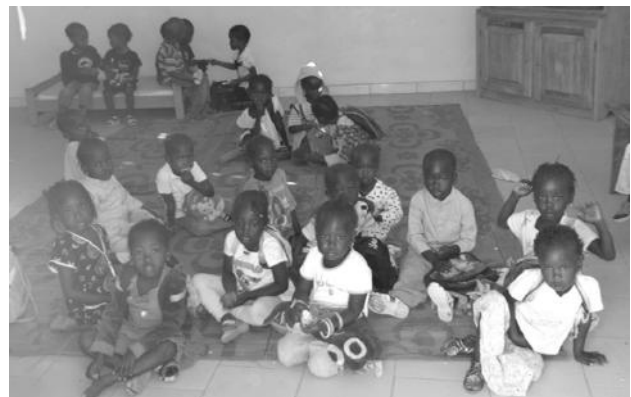
Plus de 130 enfants sont déjà accueillis par la case des tout petits