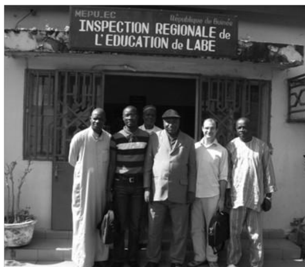
Mission du Partenariat reçue par Monsieur l'Inspecteur régional de Labé

Les échanges ont été fructueux et ont permis de définir des axes d'intervention, des partenariats possibles