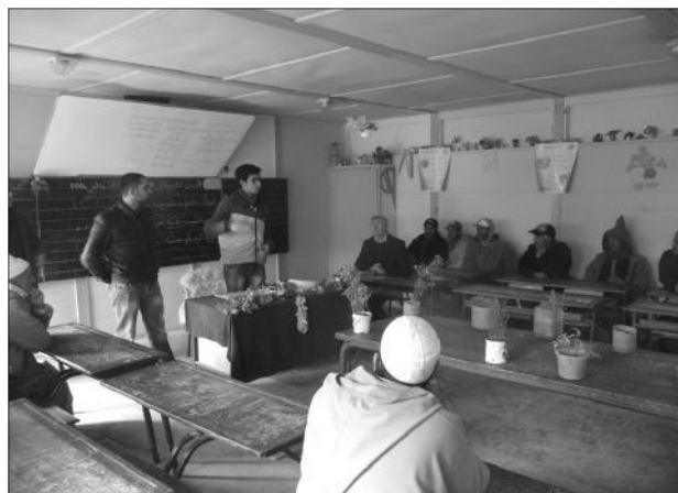
Présentation de la convention à l'école Ibnou Hanbal

Les travaux de l'école Lamrasla, située dans la commune du même nom et de l'école Oulad Ziane située dans la commune de Lahdar (nord-est de la Province de Safi) débiteront début février. L'action visera la rénovation des toilettes ou la construction de nouvelles dans certaines écoles. Enfin, l'accent sera mis sur la sensibilisation des élèves et sur la formation des enseignants pour assurer la pérennité du projet.