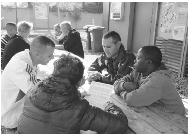
Visite du Centre Gaïa