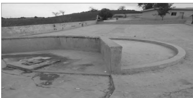
Une matfia (école de Lamrasla)

Une phase de diagnostic et de visites des écoles a été effectuée fin 2013 pour sélectionner les écoles dans lesquelles sera déployé le PAEMS. Différents outils ont été obtenus auprès des services de l'Éducation Nationale à Safi ou à Rabat et ont été compilés dans un document unique permettant d'avoir une première idée des besoins des écoles primaires rurales de la Province de Safi.