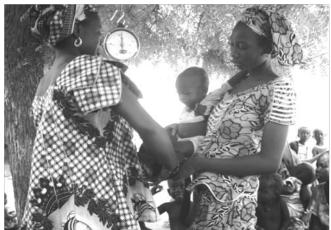
Séance de pesée d'enfants par une infirmière

Cette année le Programme Alimentaire Mondial et le PRN se sont associés pour répondre à la situation de crise nutritionnelle dans le Nord du Sénégal. Au cours des derniers mois de l'année 2013, des distributions de vivres ont été organisées par les équipes du Partenariat pour 3 000 enfants 1 600 mamans.