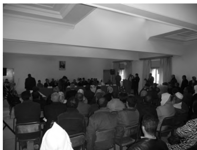
Réception à la mairie d'El Aounate