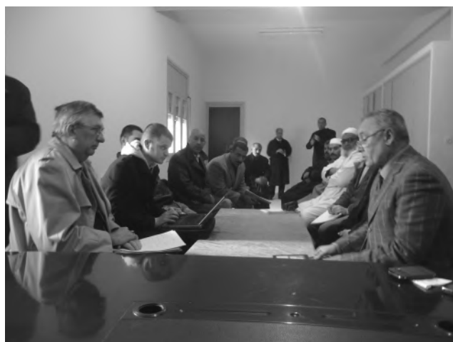
Réunion de travail avec Monsieur le Maire et le Conseil Municipal d'El Aounate