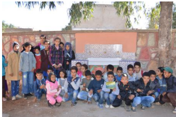
Borne fontaine de l'école Oulad Talha, Province de Safi

Et dans les communes présentant une forte mobilisation, Le Partenariat a apporté une aide financière et/ou logistique afin de soutenir les initiatives locales. Dans ce cadre, une pompe solaire a été installée dans l'école Oulad Bouali et du matériel scolaire a été fourni pour la classe de préscolaire du douar d'Oulad El Aidi (commune de Laaounate).