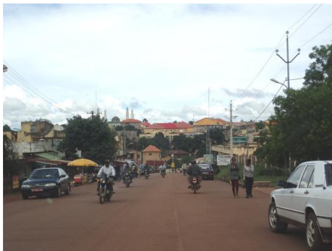
Vers le centre de Labé

C'est dans un contexte de fin d'épidémie Ebola (officielle depuis le 28 décembre) et un climat d'élections présidentielles apaisé (réélection d'Alpha Condé le 11 octobre) que Le Partenariat multiplie les rencontres avec les partenaires locaux pour bien appréhender le contexte régional de l'Éducation.