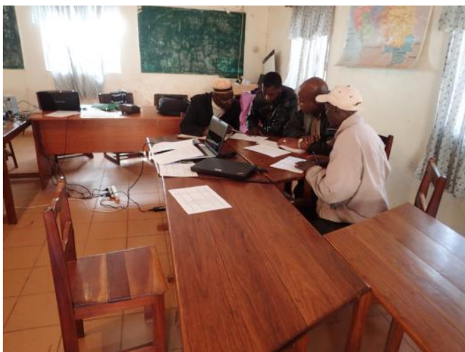
Réunion de travail avec des partenaires

Dans la Région de Labé, il y a un peu plus de 1 000 écoles élémentaires dans lesquelles sont scolarisés 144 000 enfants. Les conditions d'accès à l'eau et à l'assainissement font partie des plus mauvaises du pays : près de 40% de ces écoles n'ont pas de latrines et 75% n'ont pas de source d'eau.