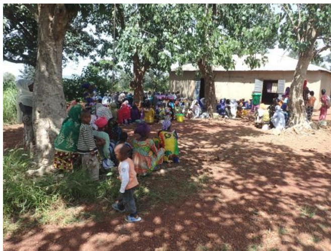
Réunion de présentation du PAEMS dans l'école de Bombi-Bourou