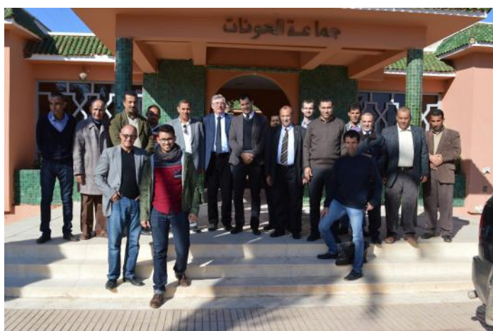
Rencontre avec le nouveau conseil communal de la commune rurale de Laaounate