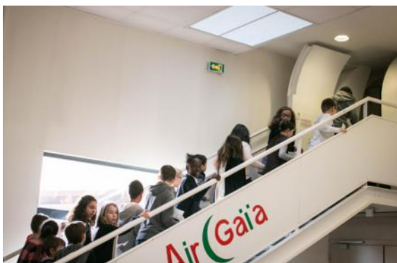
Embarquement pour le Sénégal

Madame la Ministre a goûté le jus de bissap et la nougatine préparés par les élèves et a surtout échangé avec eux sur leur expérience vécue au Sénégal durant l'atelier.