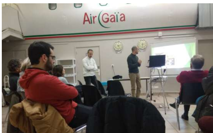
Présentation des projets menés au Sénégal et en Guinée