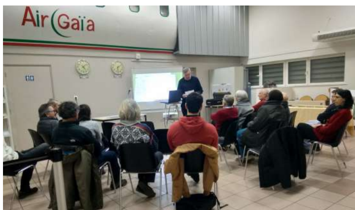
Soirée de présentation des vœux 2019

Ainsi, les 7 et 8 janvier, le comité de suivi de ce projet composé de salariés, administrateurs et membres du bureau du Partenariat s'est réuni. Le cabinet Axyom a proposé deux jours d'ateliers afin de travailler sur l'identification des forces et faiblesses de l'association et ainsi pouvoir lancer le processus de définition d'une stratégie. Ce travail va se poursuivre dans les mois à venir.