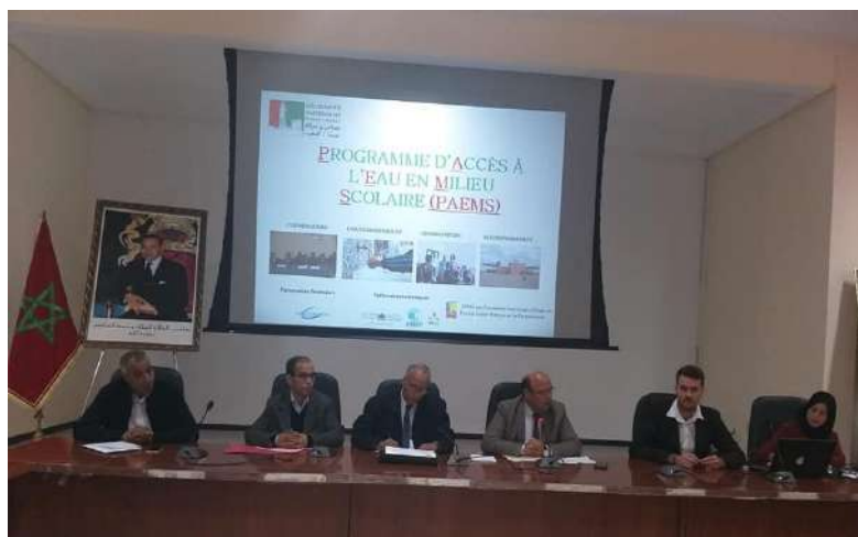
Réunion de présentation des objectifs du PAEMS (Phase III) à l'Académie Régionale d'Éducation et de Formation - Marrakech-Safi