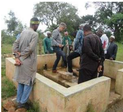
Observation du forage de SKH en Guinée dans le cadre de l'évaluation du PAEMS