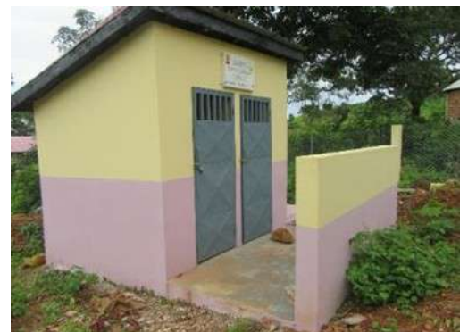
Latrines dans l'école de Doghol Timbobhe dans la commune de Lafou en Guinée