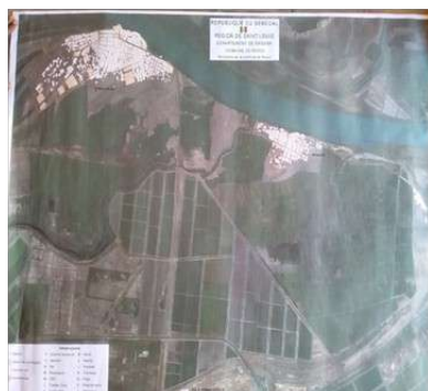
Image du cadastre de Rosso