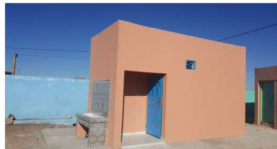
Bloc sanitaire construit pour l'école Brahma

Enfin cette année a surtout permis de renforcer les liens existants, mais surtout d'élargir le cercle de nos partenaires, grâce aux ateliers de capitalisation du PAEMS au mois d'avril. C'est par ce dialogue et par l'implication des participants, que nous avons pu construire des outils importants en vue de la démultiplication du programme, mais aussi une base de réflexion pour les années à venir.