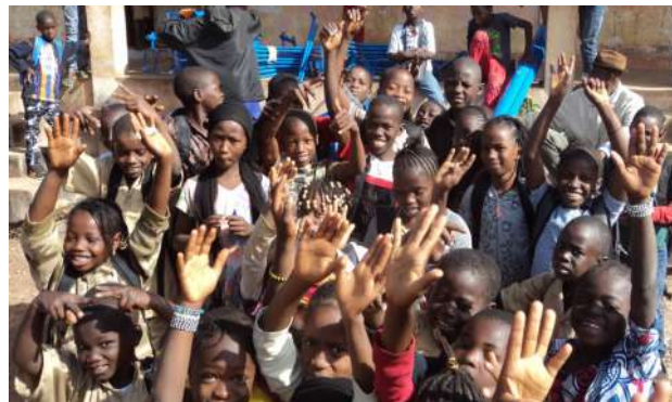
Les élèves de Konkola heureux de l'appui apporté à leur école

En 2019, l'approche sera étendue à cinq écoles supplémentaires en zones rurales. Les sensibilisations sur le lavage des mains et la mise en place des activités quotidiennes de FFS sont prévues en 2019.