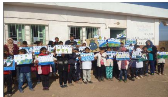
Sensibilisation à l'hygiène à l'école Lkordane de la commune rurale Jane BIOUH