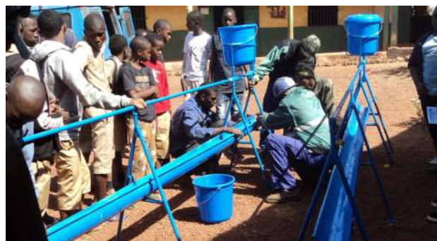
Montage des stations à l'école de Daka 1

Selon les dispositions prises, les stations de lavage des mains sont installées devant la salle de classe ou à l'intérieur de celle-ci.