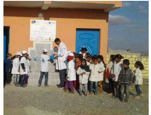
Sensibilisation à l'eau, l'hygiène et l'assainissement à l'école Sbabha au Maroc

Nous tenons à remercier l'ensemble de nos partenaires sans qui ce programme ne pourrait exister. Et nous poursuivons le PAEMS avec le lancement de la troisième phase du projet (2019-2021).