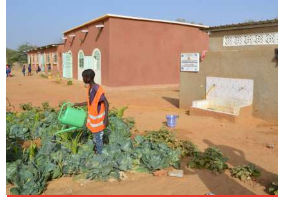
Exemple de projet de maraichage

Nous vous remercions pour votre précieux soutien.