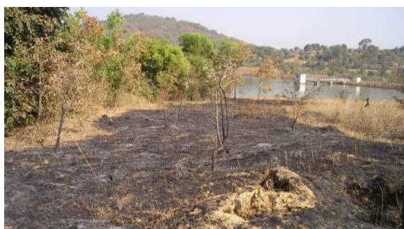
Réalisation des pare-feux pour protéger la forêt