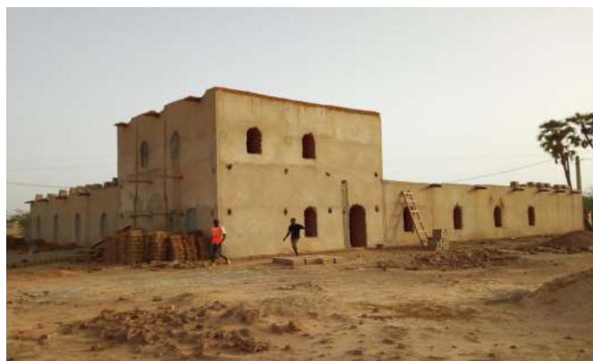
Construction de l'Hôtel de département de Matam grâce à la technique de Voûte Nubienne