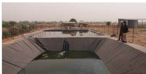
La station de lagunage de Rosso

La station de dépose des boues de vidange de lagunage de Rosso a été réceptionnée et fonctionne depuis avril 2018. Elle est constituée de trois bassins reliés en série avec un réceptacle conçu pour recueillir les eaux usées de la commune. Cette station de lagunage permet de retenir toutes les saletés et les matières flottantes.