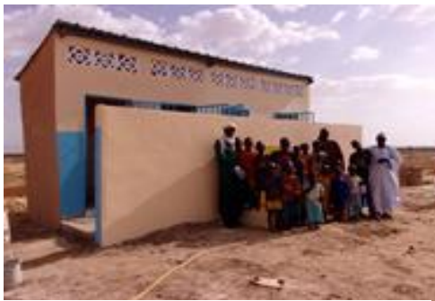
Bloc sanitaire et borne fontaine