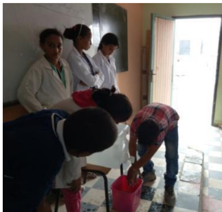
Journée Mondiale du lavage des mains - 15 octobre 2017