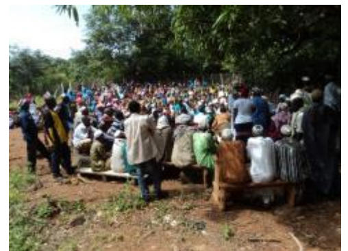
Forte mobilisation à Garantan pour accueillir la délégation de l'Ambassade du Japon - octobre 2017