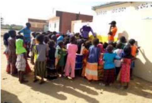
Séance de sensibilisation

Au total, 11 écoles ont bénéficié du pack intégré PAEMS pour environ 940 élèves dont 547 filles et 34 enseignants et de deux extensions hydrauliques avec des bornes-fontaines villageoises qui ont desservi environ 1 000 habitants.