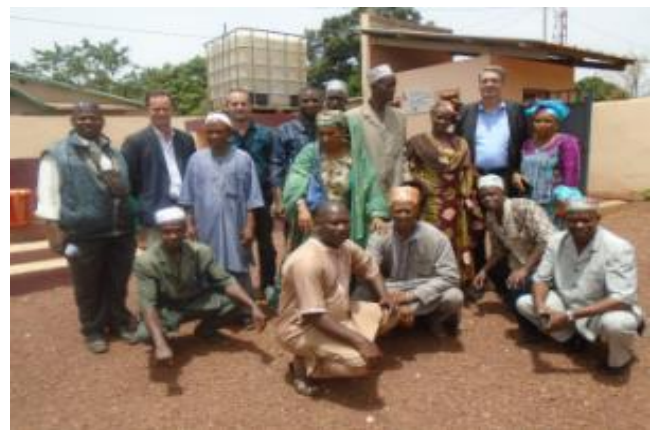
Visite de l'Ambassadeur de France - Mai 2017

D'importantes personnalités comme l'Ambassadeur de France en Guinée et au Sierra-Leone et le Ministre de l'Education Nationale et de l'Alphabétisation ont pu constater directement sur le terrain les intérêts et impacts immédiats du PAEMS en matière d'accès à l'eau, l'assainissement et la sécurisation de l'école.