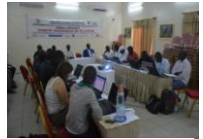
Partage et validation de l'Atlas

Au Sénégal, l'année 2 de la mise en œuvre du PAEMS a été marquée par la réalisation de l'Atlas sur l'accès à l'eau et à l'assainissement en milieu scolaire, validé durant les Comités de Pilotage. Il s'agit d'un outil important de communication, de plaidoyer et d'aide à la décision. Les acteurs de l'Education dans les régions de Saint-Louis et de Matam, conscients des acquis et avancées notés dans le cadre du PAEMS, souhaitent disposer d'un outil de pression au niveau central. Cet atlas est le résultat d'un programme d'investissement prioritaire aligné sur le Plan Sénégal Emergent (PSE) et les ODD, dans le but de mobiliser davantage de ressources auprès de l'Etat sénégalais et des bailleurs pour un accès universel à l'eau et à l'assainissement en milieu scolaire à moyen terme.