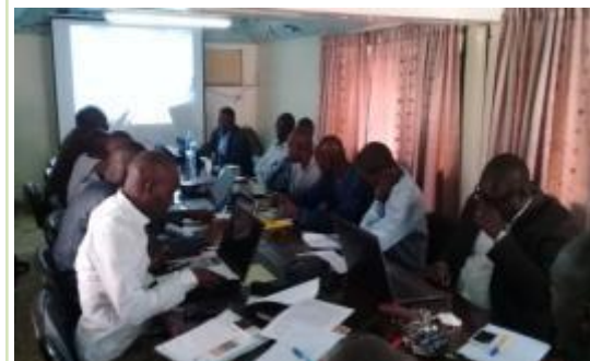
Lancement du comité de capitalisation au Sénégal - décembre 2017