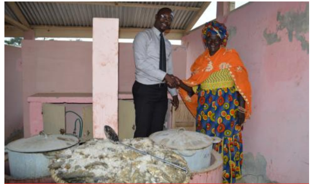
Une unité de production de biogaz mise en place pour les femmes transformatrices de poisson de Guet Ndar