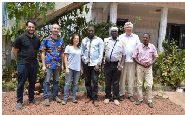
Les équipes du Partenariat de Lille et de Guinée se rencontrent à Labé