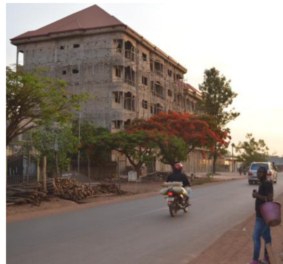
Vue de la commune urbaine de Labé en Guinée

Les projets qui seront menés relèveront principalement de l'axe « appui institutionnel ». L'objectif est de favoriser le développement économique local, d'améliorer le recouvrement des taxes locales et de renforcer les capacités de gestion de la commune. L'amélioration de la qualité de service offert aux populations de Labé est le principal enjeu du projet.