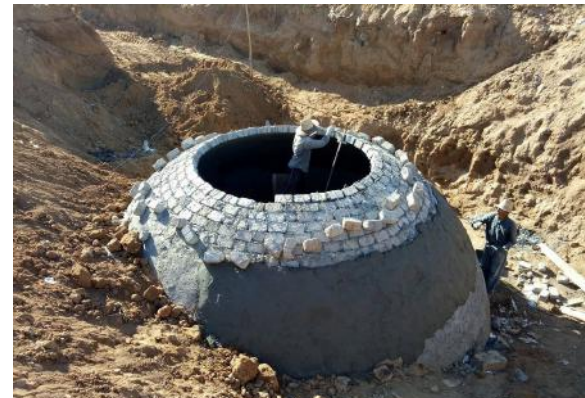
La cuve de méthanisation en cours de construction

Dans la continuité des actions mises en place à El Aounate, une nouvelle commune, Jemaa Shaïme, sera accompagnée dans le développement de solutions de méthanisation. Ainsi, les abattoirs de cette commune seront, prochainement, équipés d'une nouvelle cuve, avec une technologie inédite et adaptée aux besoins en assainissement et énergie de la commune.