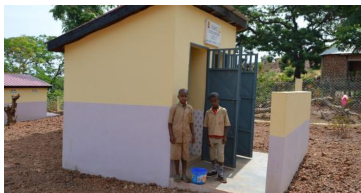
Les enfants utilisent les latrines construites dans une école de la région de Labé en Guinée