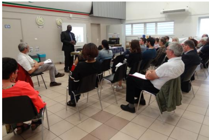
Présentations des activités lors de l'Assemblée Générale 2019

Nous tenons également à remercier l'Agence de l'Eau Artois-Picardie et la Ville de Creil, partenaires de nos projets, pour leur présence lors de cette assemblée.