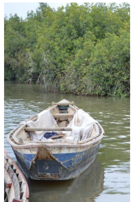
Vue de la Mangrove de Saint-Louis

Nous remercions ces acteurs pour leur implication, au côté du Partenariat et de tous ses partenaires, pour la préservation de la mangrove de Saint-Louis.