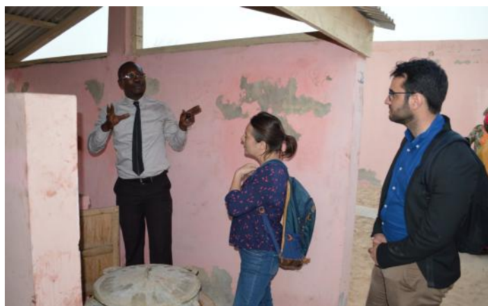
Visite des installations de production de biogaz à Guet Ndar : le quartier des pêcheurs de Saint-Louis au Sénégal