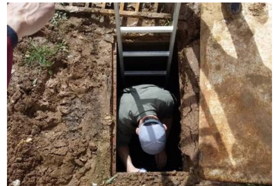
L'accès actuel à la cuve de méthanisation