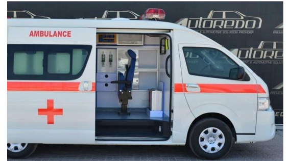
L'ambulance destinée à la commune de Rosso

La commune de Rosso dispose, actuellement, de postes de santé mais ils ne permettent pas toujours de soigner les habitants de Rosso. Dans ce cas, il est nécessaire de les évacuer vers le centre de santé de Richard-Toll ou vers l'hôpital, plus éloigné, de Saint-Louis.