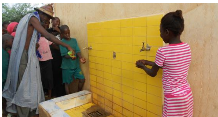
La borne fontaine installée permet l'apprentissage du lavage des mains dans une école de Saint-Louis au Sénégal

La subvention accordée par l'AFD représente 750 000 € pour les trois années de mise en œuvre soit 42 % du budget total du PAEMS phase 3.